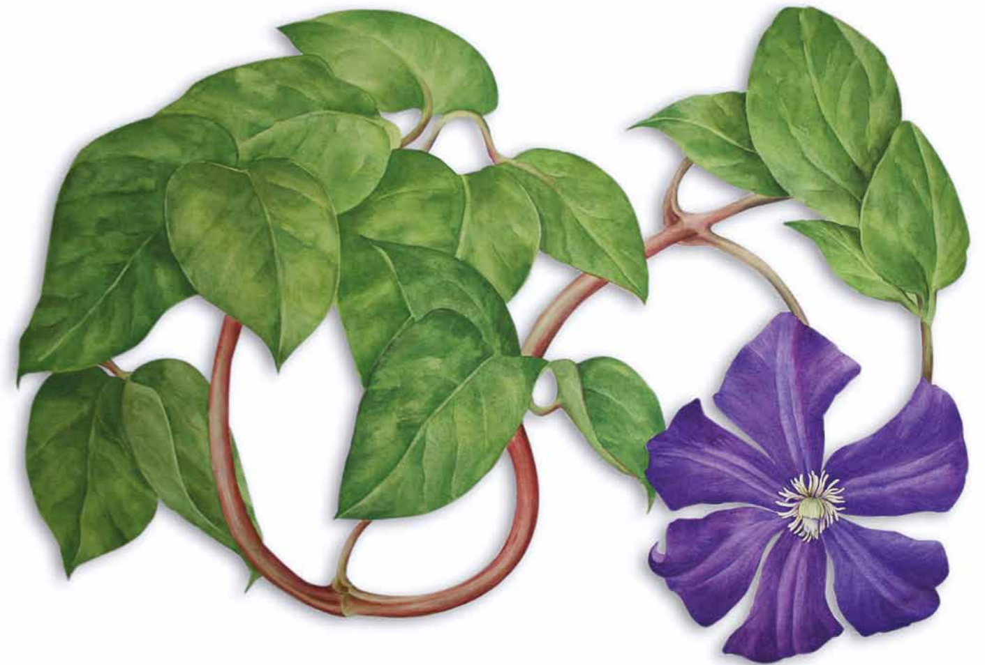
Tania Engelke Clematis

Einzelblüte aus der 3-teiligen Installation · 2011 · Aquarell auf 600 g Bütten · ca. 60 x 80 cm