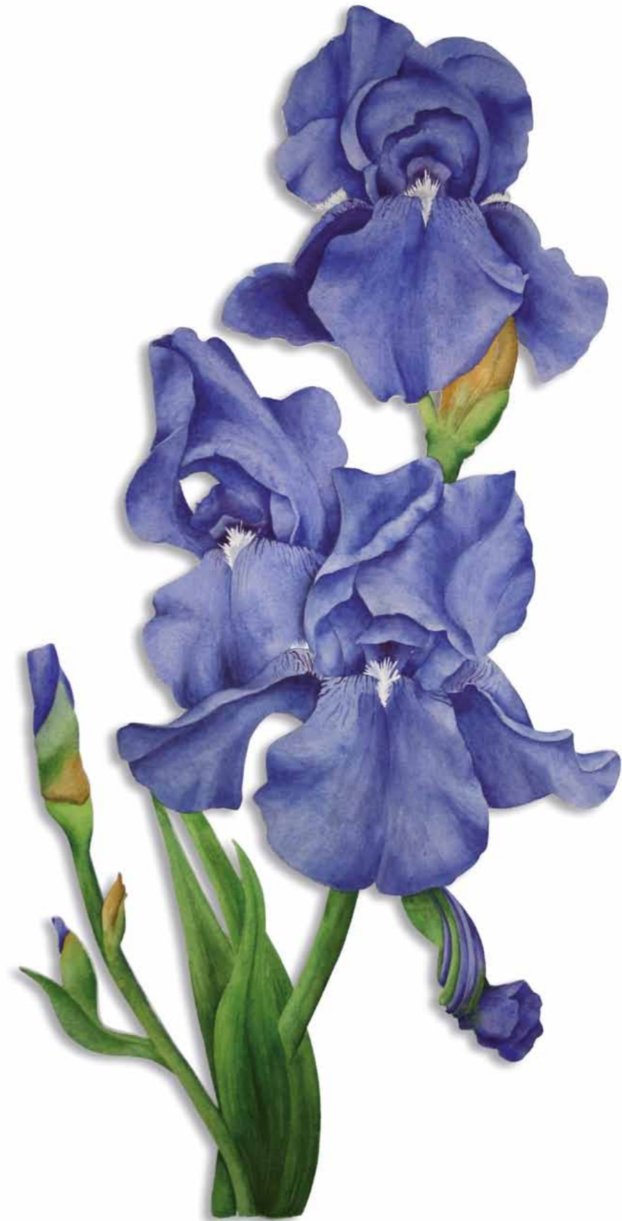
Tania Engelke Durch die Blume · Iris

2009 · Aquarell · Büttchen auf Holz · ca. 60 x 30 cm