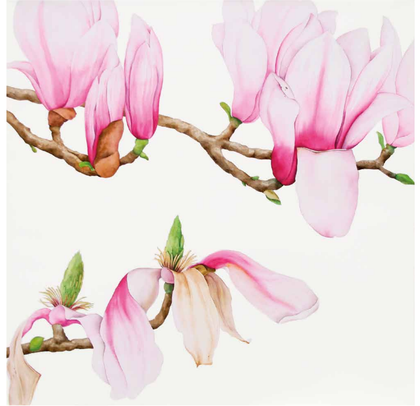
Tania Engelke Magnolien

2007 · Aquarell · Büttchen auf Keilrahmen · 25 x 80 cm