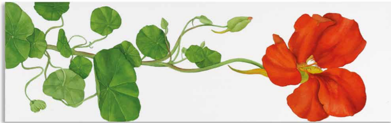
Tania Engelke Liegende Kresse · gelb / Liegende Kresse · orange

2007 · Aquarell · Büttchen auf Keilrahmen · 25 x 80 cm