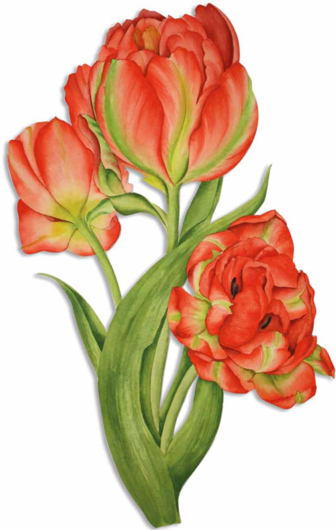
Tania Engelke Durch die Blume · Tulpe

2009 · Aquarell · Büttchen auf Holz · ca. 60 x 30 cm