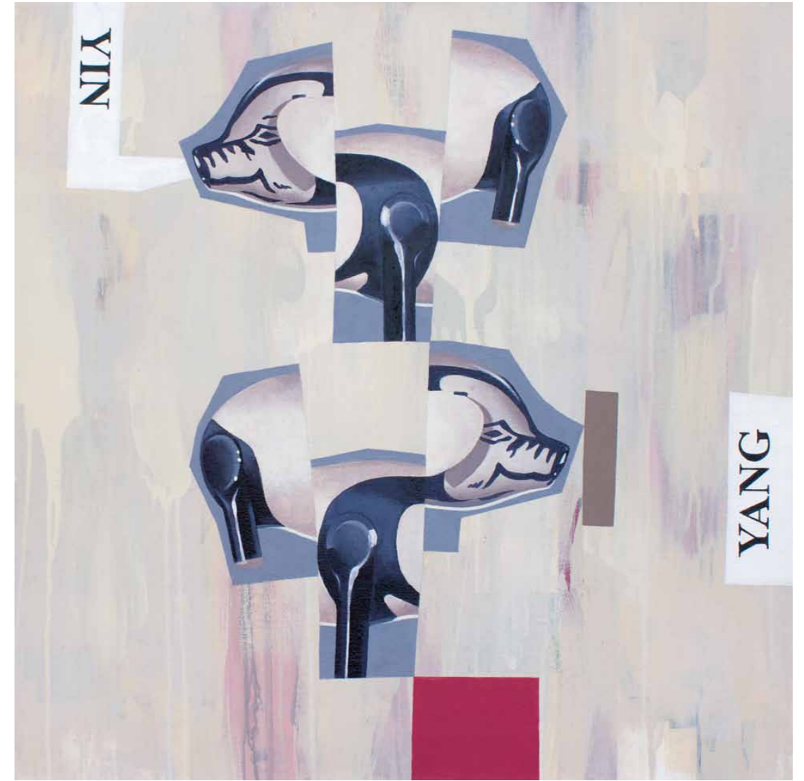
Schweinehälften 2014 · Acryl auf Leinwand · 60 x 60 cm