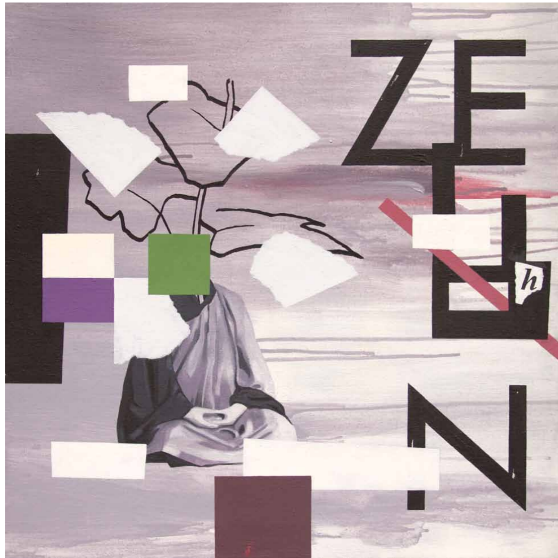
Ze(h)n 2014 · Acryl auf Leinwand · 60 x 60 cm