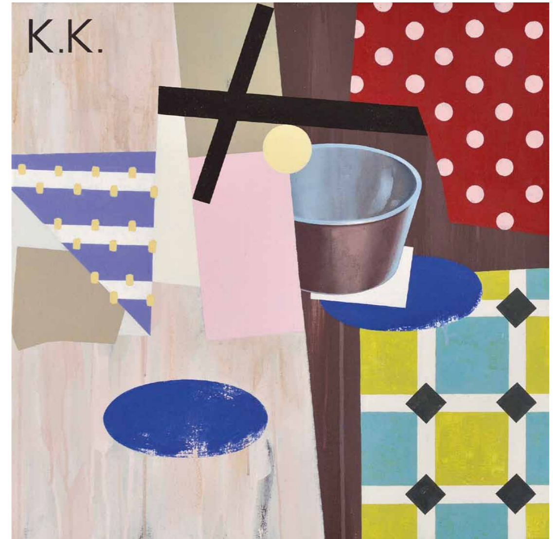
Die Küche (kubistisch-konstruktivistisch) 2011 · Acryl auf Leinwand · 60 x 60 cm