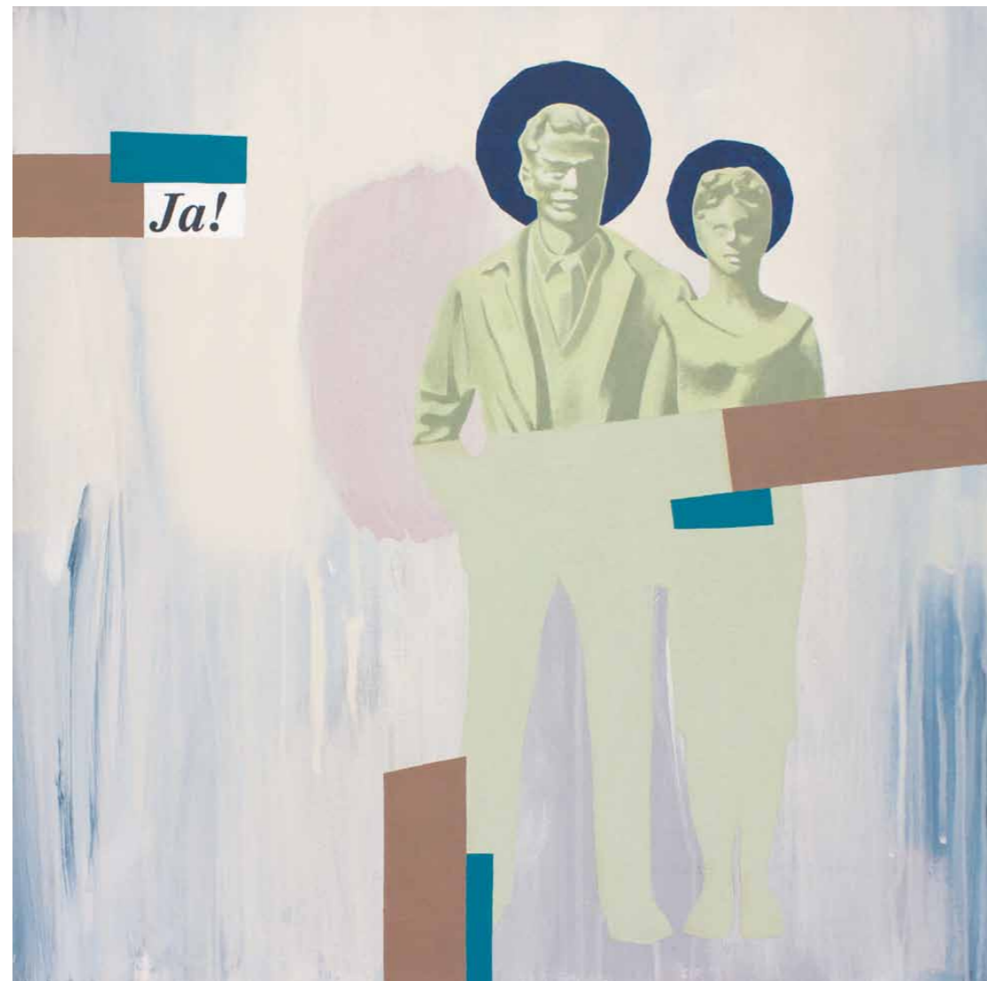
Mysterium 2014 · Acryl auf Leinwand · 60 x 60 cm