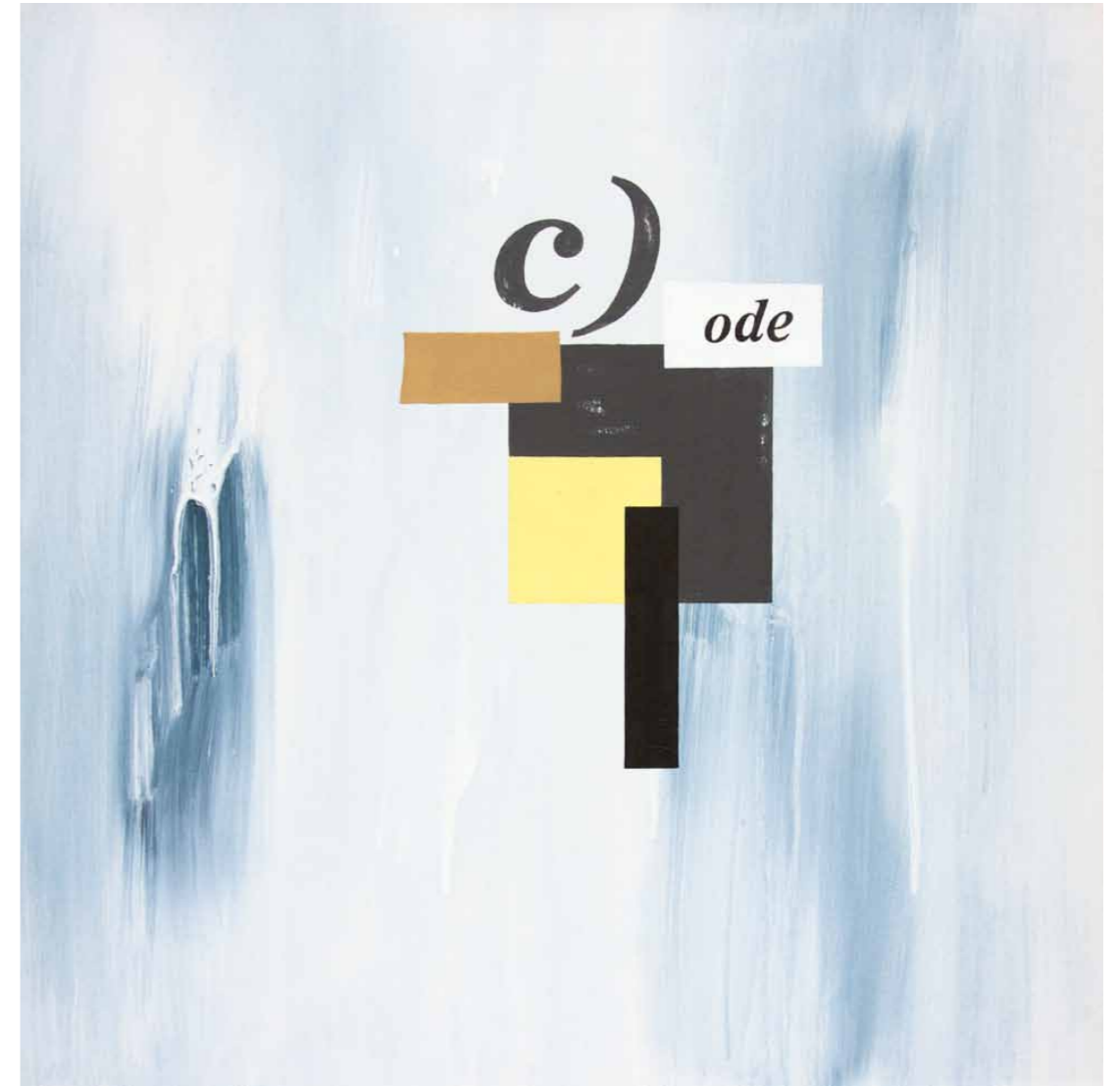
C)ode 2011 · Acryl auf Leinwand · 60 x 60 cm