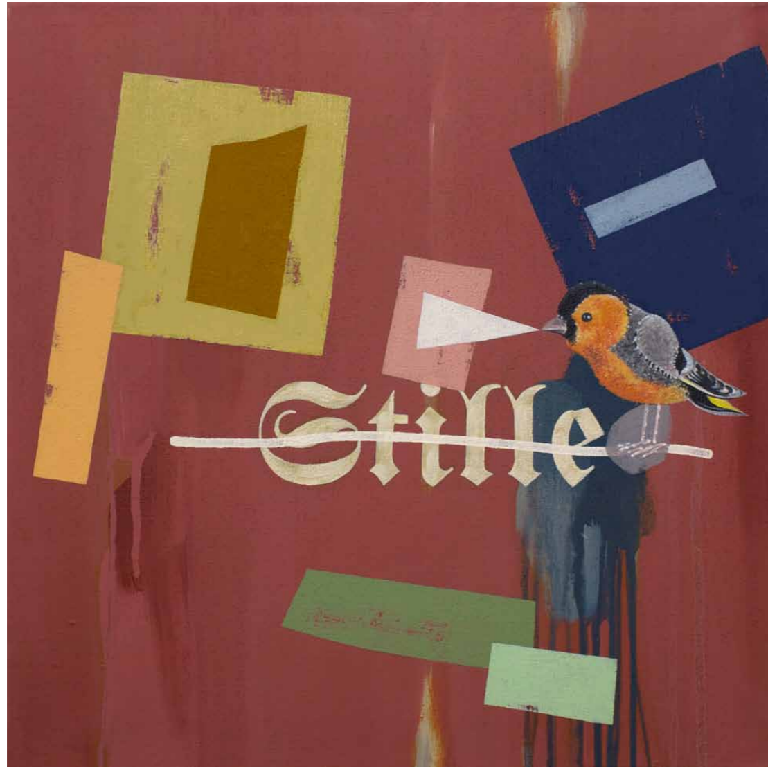
Stille 2014 · Acryl auf Leinwand · 60 x 60 cm