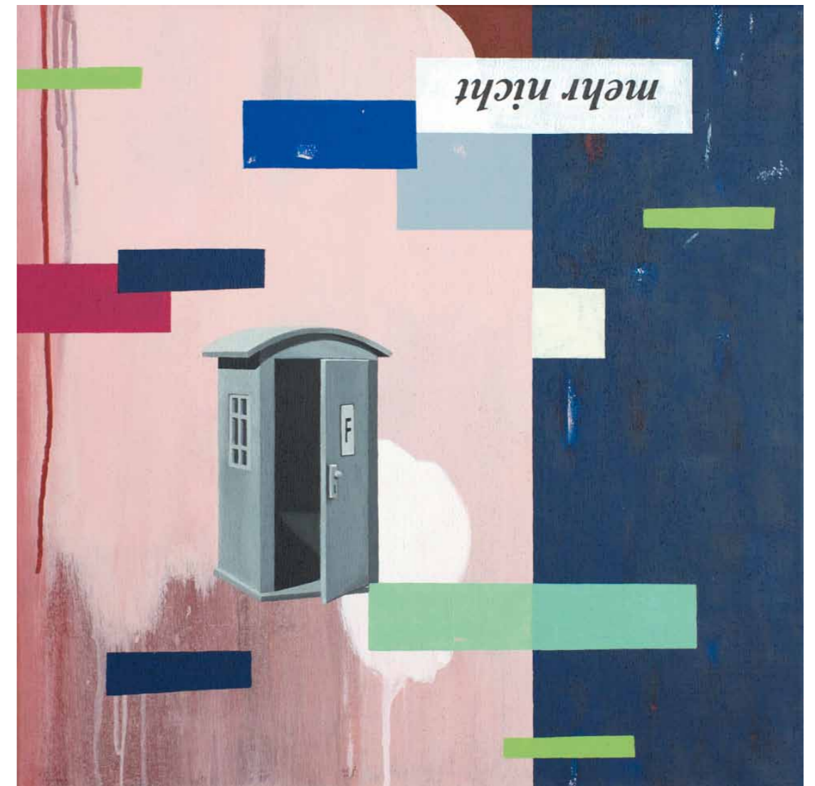
Fernsprecherei 2012 · Acryl auf Leinwand · 60 x 60 cm