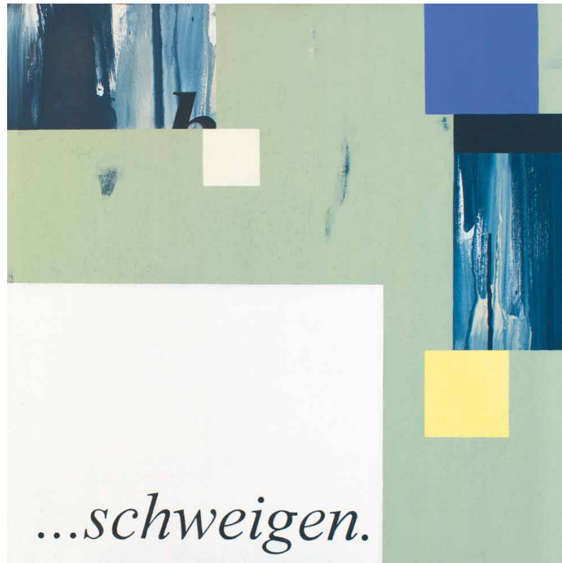
Wittgenstein 2012 · Acryl auf Leinwand · 60 x 60 cm