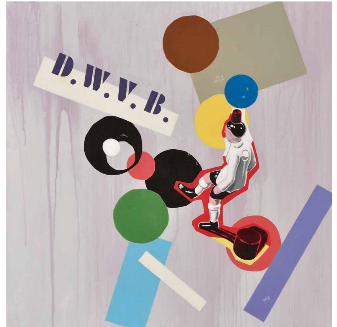
D.W.V.B. (Das Wunder von Bern) 2011 · Acryl auf Leinwand · 60 x 60 cm