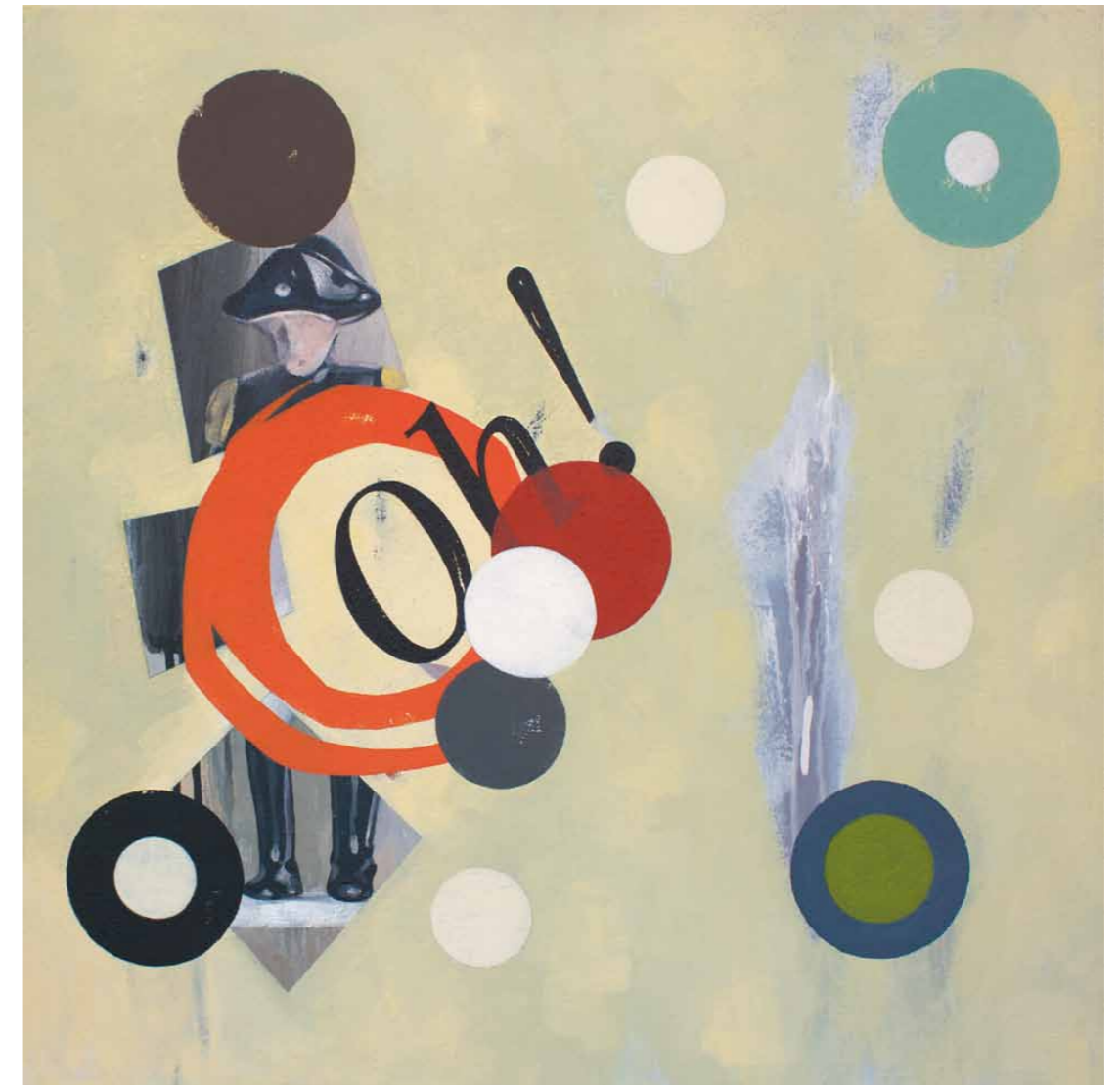
Oh! 2011 · Acryl auf Leinwand · 60 x 60 cm