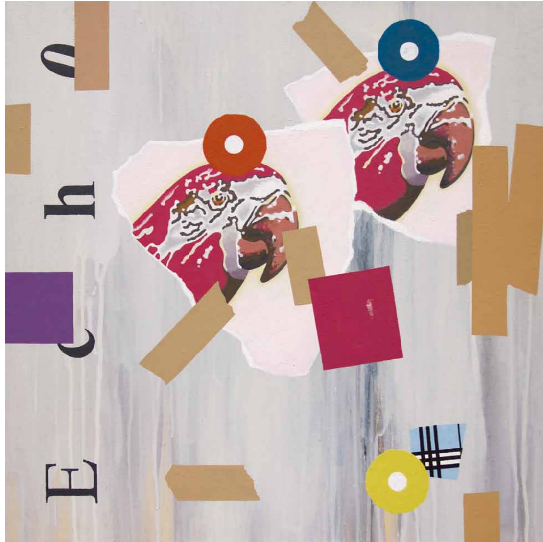
Echo 2014 · Acryl auf Leinwand · 60 x 60 cm