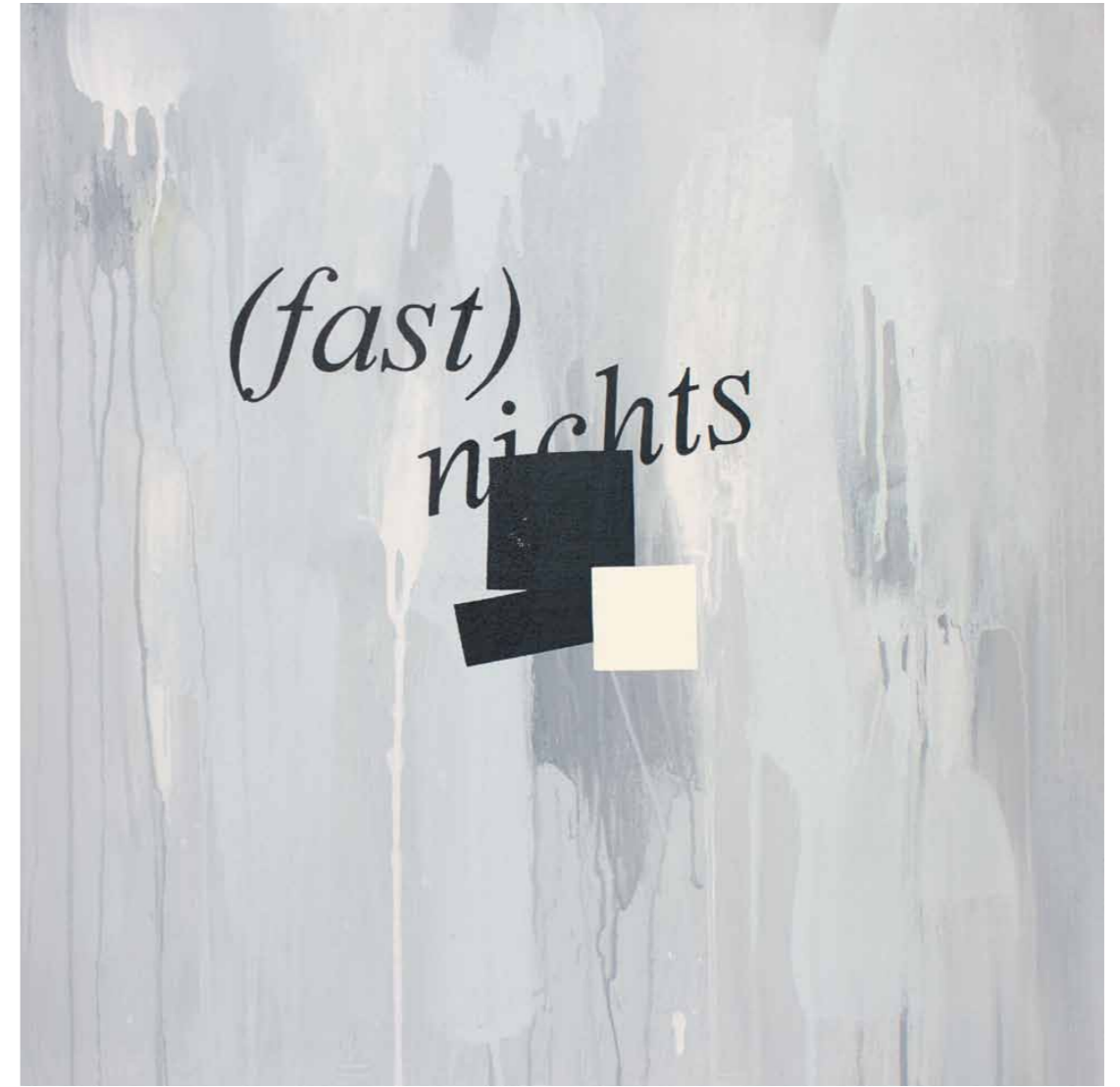
Dekonstruktion eines Quadrates 2011 · Acryl auf Leinwand · 60 x 60 cm