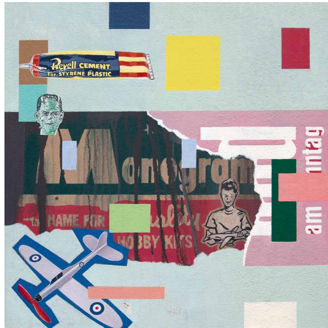
Sonntagsmalerei 2015 · Öl/Acryl auf Leinwand · 60 x 60 cm