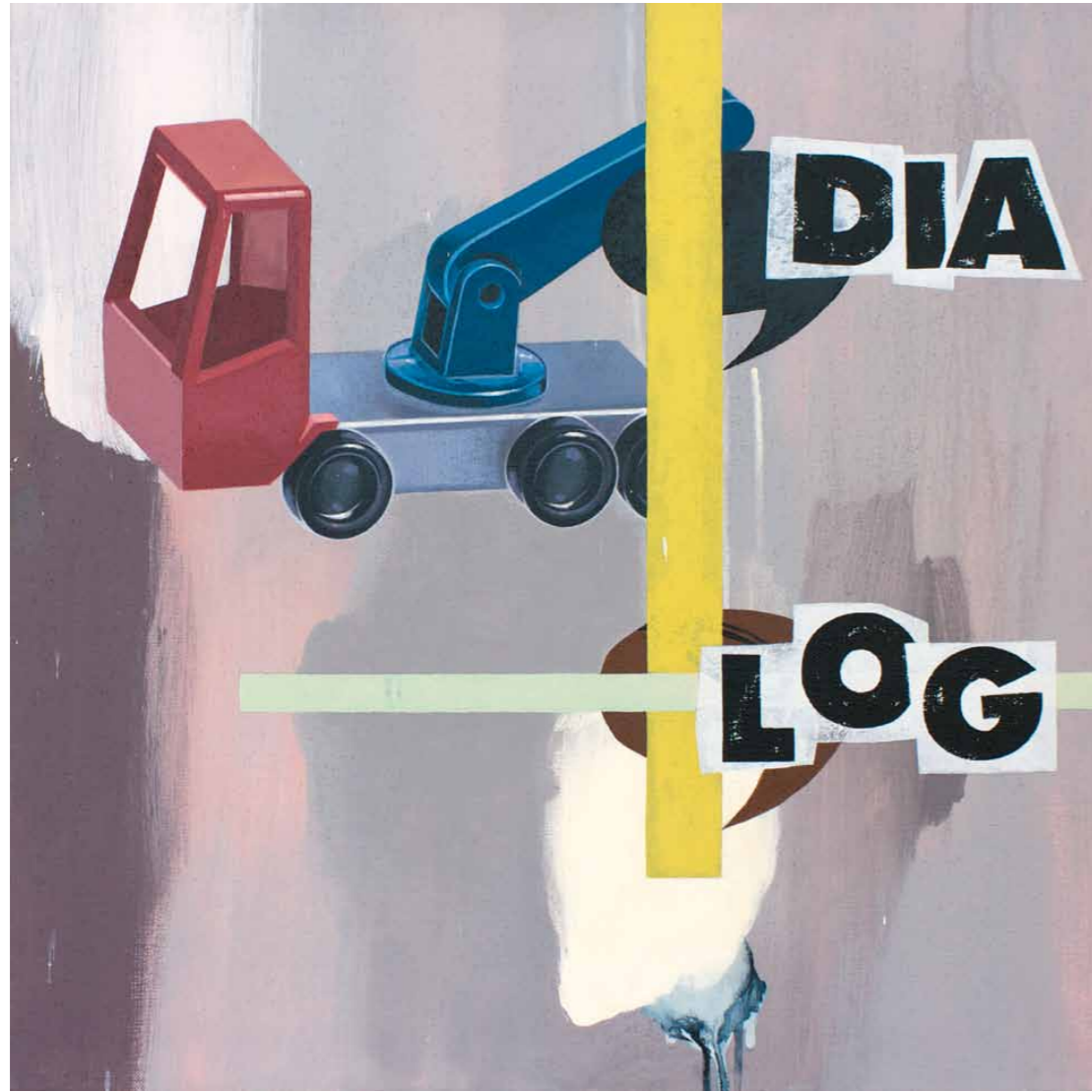
Dialog 2011 · Acryl auf Leinwand · 60 x 60 cm